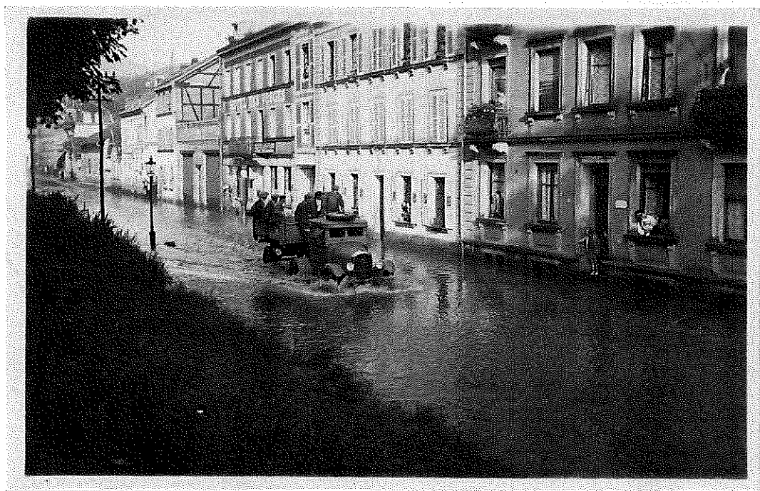
Sainte-Marie-aux-Mines lors des inondations de juillet 1933

Pour cela nous avons besoin de l'aide de tous. Vous connaissez des repères de crues oubliés, vous avez des informations personnelles relatives aux inondations ou aux coulées de boue (documents, témoignages, photographies, vidéos, cartes postales, etc.) actuelles ou anciennes ? Mettez-les à la disposition de tous soit en informant Lise MARTIN à la Communauté de Communes de Sélestat (mail : lise.martin@cc-selestat.fr / Tél : 03.88.58.01.60), soit en les partageant sur le site www.orrion.fr (Observatoire Régional des Inondations en Alsace), créé par l'Université de Haute-Alsace. ORRION a pour objectif de permettre le partage des connaissances, des savoirs, des mémoires dans le but de construire une culture du risque collectivement partagée en Alsace.